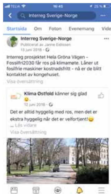
Print Screens från programmets Facebook- och Instagram-sidor, där handläggarna främst förmedlar information om projektaktiviteter från projektens sociala media. Facebook används också för att marknadsföra utlysningar och berätta om möten i övervakningskommittén och i styrkommittéerna.