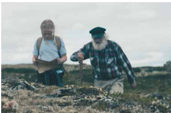
Kring Fulufjället upplever du vildmark i två nationalparker, bara några timmar från vardagen. Se filmen om de båda nationalparkerna på www.fulufjallet.se

Projektägare var Länsstyrelsen i Dalarnas län och Fylkesmannen i Hedmark.