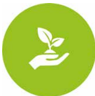
Natur- och kulturarv