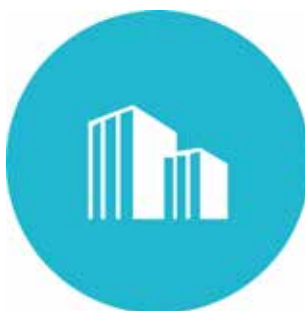
Små och medelstora företag