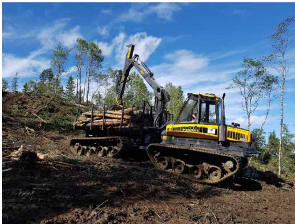
Ett exempel på skonsammare drivningsmetoder – en bandgående skotare under utveckling.

Projektägare är Skogsstyrelsen och Fylkesmannen i Trøndelag.