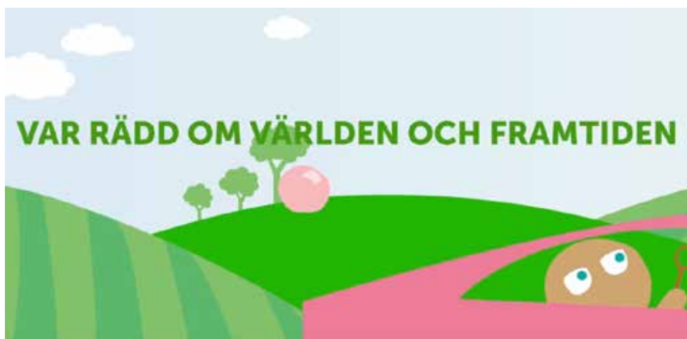
Bild från en av projektets filmer med budskapet "Var rädd om världen och framtiden – byt drivmedel!". Filmer har tagits fram med jämställdhet och jämlikhet i åtanke – animerade figurer utan stereotypa föreställningar om könsroller och med varierande utseende och olika hudfärg.

Projektägare var Region Värmland och Kunnskapsbyen Lillestrøm.