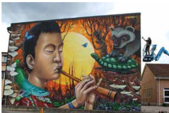
BID i praktiken – fasadkonst i Torsby 2017, samfinansierat av fastighetsägare och Torsby kommun.

Projektägare var Länsstyrelsen i Dalarnas län och Regionrådet för Fjellregionen.