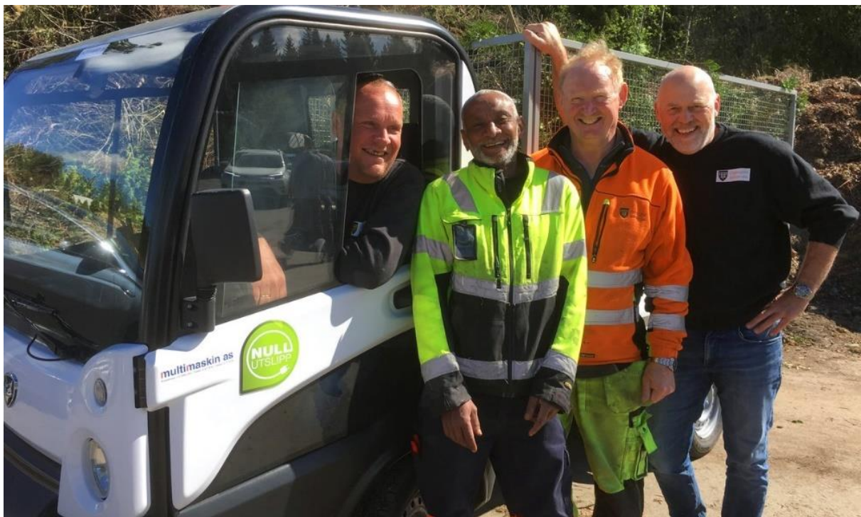
Ett glatt gäng som genom projektets utlåningscentral bytte ut diesellastbilen mot en eldriven lätt lastbil. När låneperioden var slut ville de inte lämna den ifrån sig. Exemplets makt är stor. Att pröva själv är större.

En del i detta handlar om omställning till fossilfria arbetsmaskiner där man har stor nytta av att samarbeta över gränsen. De norska parterna i projektet har en framgångsrik utlåningscentral som erbjuder möjligheten att testa nya fossilfria arbetsfordon och arbetsmaskiner. Allt från fossilfria traktorgrävare till eldrivna trädgårdsredskap finns tillgängligt. Du lånar det du behöver, och testar i din vardagliga verksamhet under några veckor. På svensk sida drar man erfarenhet av detta och en inventering av kommunernas befintliga flotta och kommande behov pågår.