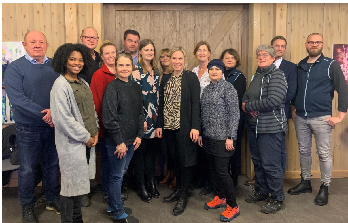
Interregsekretariatet samlade till möte i Trøndelag

På svensk sida är förvaltande myndighet och ett gemensamt sekretariat placerat i Östersund på Länsstyrelsen Jämtlands län. De har ett samarbete med de regionala kontaktpersonerna som finns hos de tillväxtansvariga i programområdets respektive län. På norsk sida finns det tre sekretariat som även är förvaltande organisationer. Trøndelag har kontor på två platser, i Steinkjer och Trondheim och de samarbetar med Sverige för delområdet Nordens Gröna Bälte. Vid Hedmark fylkeskommune har sekretariatet för Inre Skandinavien sin hemvist i Hamar. I Sarpsborg på Østfold fylkeskommune finns det norska sekretariatet för Gränslöst Samarbete.