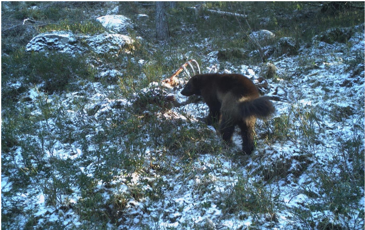
En järv besöker resterna efter en vargdödad älg i ett vargrevir i södra Dalarna. Bilden är fotograferad med automatisk fältkamera som sätts upp vid rester från vargdödade och skjutna älgar för att undersöka i vilken omfattning järvar äter av resterna.

Projektet GRENSEVILT arbetar med att skapa förutsättningar för en förbättrad och gränsöverskridande flerartsförvaltning av älg, varg och järv. Projektet inkluderar också frågor om jakt och skogsbruk.