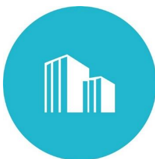
Små och medel- stora företag