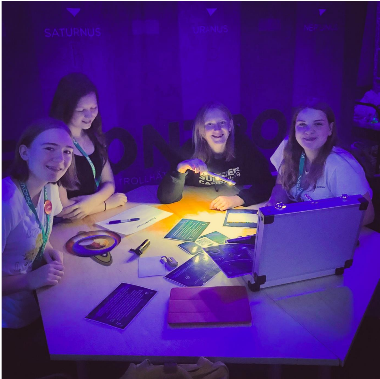
Projektet Få Alle Med arbetar med att förebygga skolavhopp och frånvaro genom att fokusera på personliga färdigheter som komplement till ämneskunskaper. Vilket på sikt kan säkra tillgång på arbetskraft i gränsregionen. En vinst för den sociala och ekonomiska hållbarheten, samt för den enskilda individen.