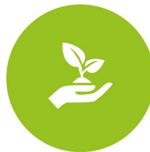
Natur- och kulturarv