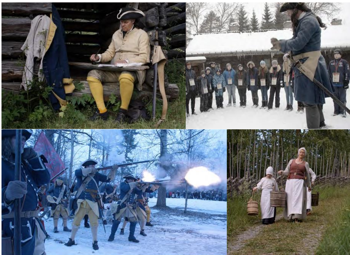
Klipp från filmdokumentation med scener från "Karoliner och konflikter" och "Karolinervinter" samt iscensatta inslag från museet Jamtlis utomhusmiljöer.

Som exempel kan nämnas gruppövningarna som genomfördes på Hommelvik skole, en skola där även många med flyktningbakgrund går. 300-årsmarkeringen gav skolan möjlighet att inte bara belysa hur man i Jämtland och Trøndelag trots tidigare konflikter har en vänskaplig relation utan man kunde även koppla händelserna till konflikter i världen idag och diskutera vikten av fred och vad krig egentligen innebär.