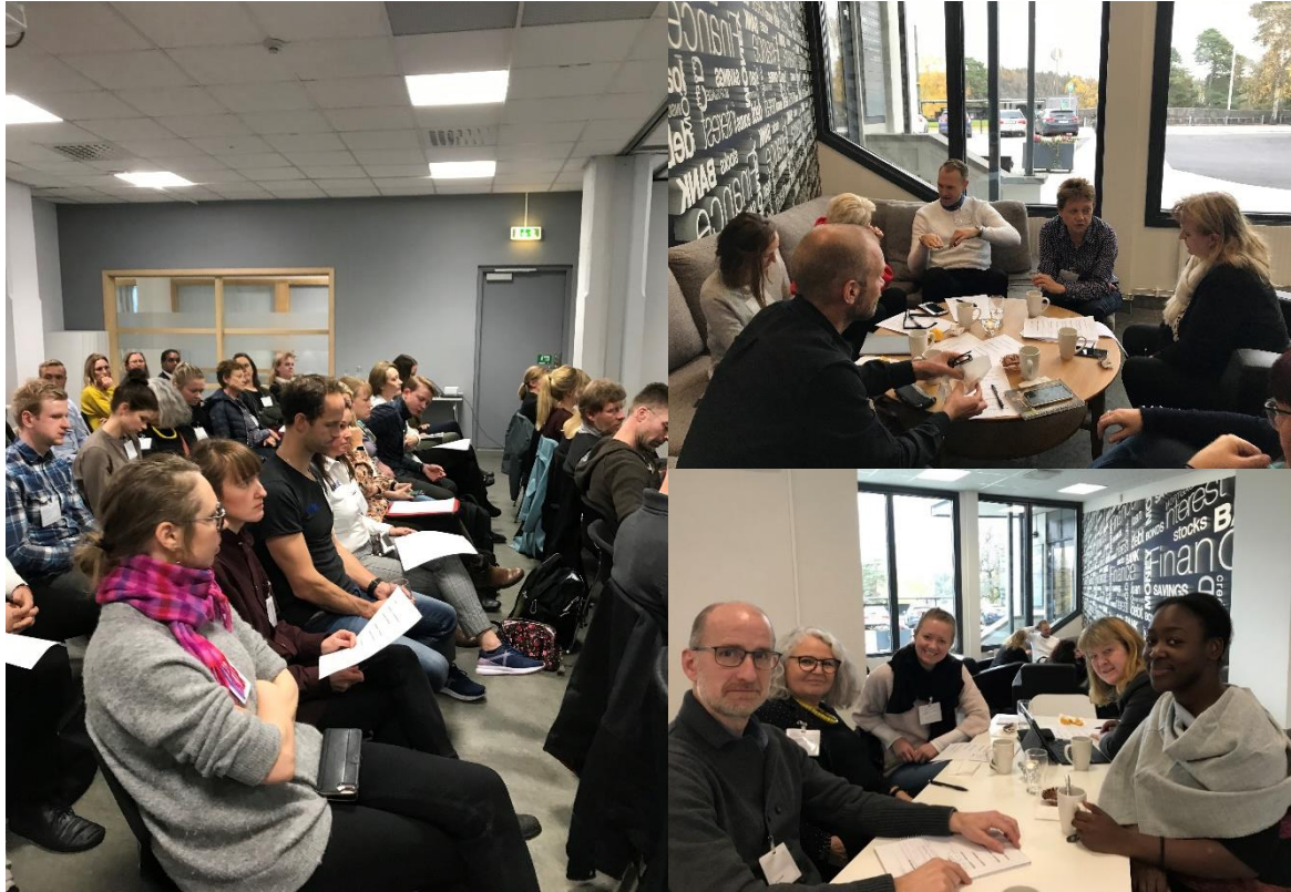
Projekt med många olika verksamheter från hela programområdet samlade på kommunikationskonferens

På webbplatsen www.interreg-sverige-norge.com finns nyheter och information för sökande, pågående projekt och övriga intressenter. Programmet finns även på Facebook – sök på Interreg Sverige-Norge. Där hittar du information om projekts aktiviteter och ögonblicksbilder från genomförandet av programmet.