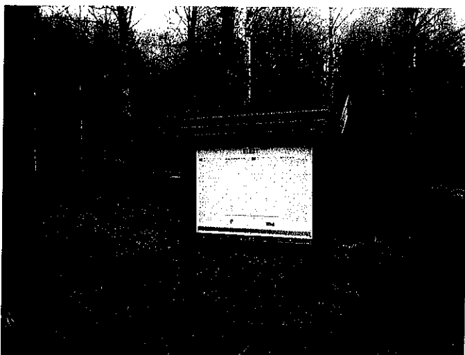
Info tavle ved Berby

Størrelsen på tavlene vil være omlag 150 cm x 220 cm. Rammeverk i tre, selve informasjons delen blir i laminert hardplast. Tavlene må festes skikkelig, monteres på stålbrakett / fot slik at de blir stående stabilt. Det er viktig at det velges materialer som tåler vær og vind samt at alle tavler er skikkelig montert.