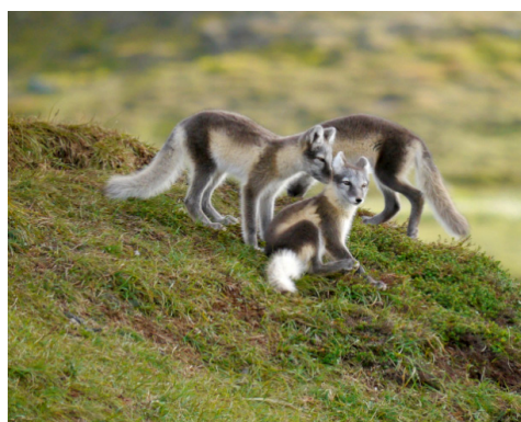
Bilderna på fjällrävarna är från projektets hemsida och ett bildspel av Sandra Jonsson WWF Sverige.