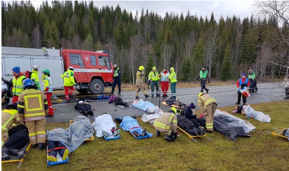
Gemensam krisövning i Meråker, hösten 2016.