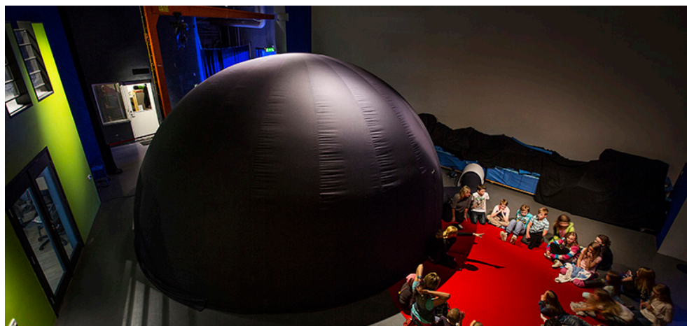
Deltagare i First LEGO league samt Planetariet i Innovatum Science Center där ungdomar kan titta på planeter.