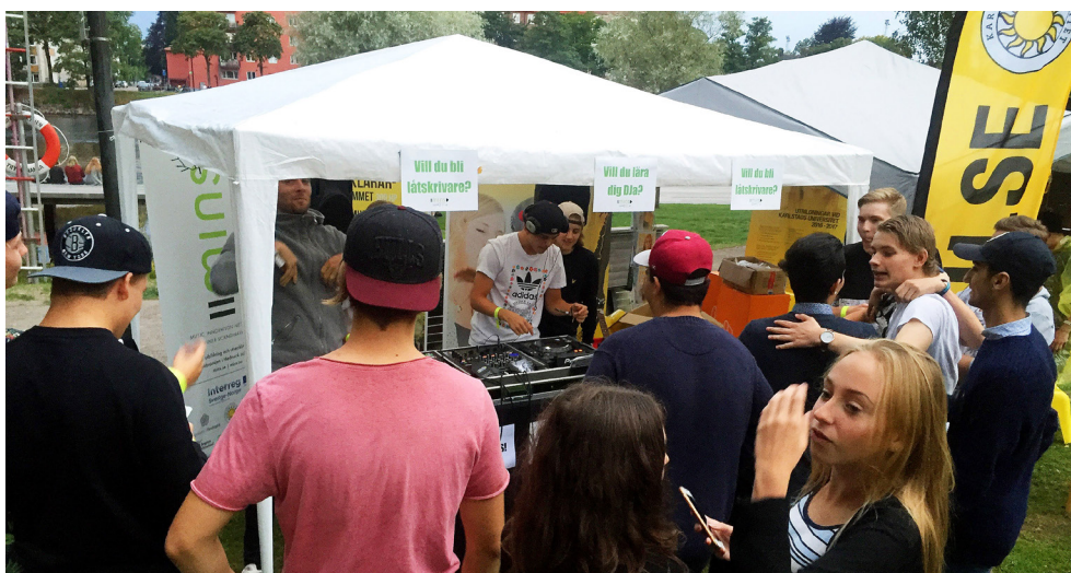
En discjockey spelar på Island Festival i Karlstad, sommaren 2016.

Music Innovation Network är ett projekt som kombinerar forskning och erfarenheter från musikbranschen i syfte att stärka aktörer på en global marknad.