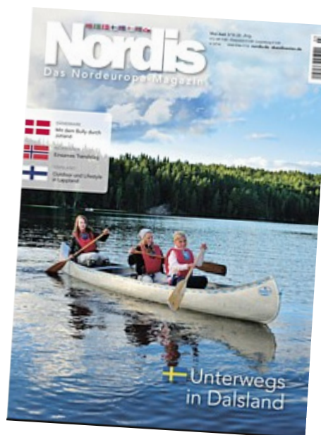
Omslaget på det tyska magasinet Nordis när de besökte Dalsland

Projektet arbetar även aktivt med ett starta upp en ny säljportal som ska effektivisera säljandet av vandrings- och cykelresor. Projektägare är Dalsland turist AB och Havass skog.