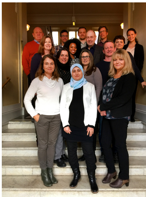
Ett axplock av norsk och svensk personal under ett sekretariatsmöte i Åmål.

Vid Hedmark fylkeskommune har sekretariatet för Inre Skandinavien sin hemvist i Hamar. I Sarpsborg på Østfold fylkeskommunen finns det norska sekretariatet för Gränslöst samarbete.