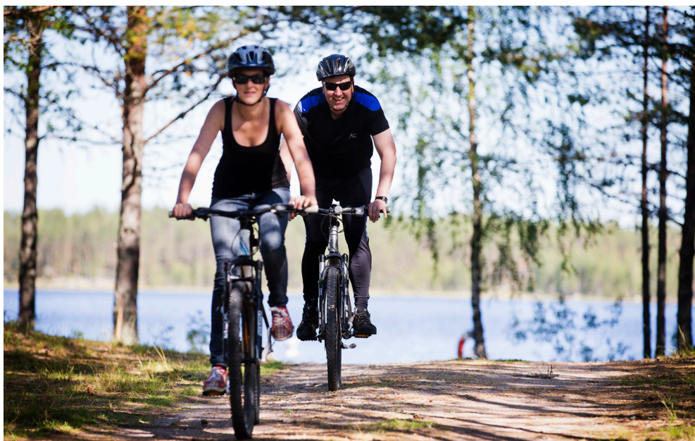
I området finns det många cykelturistleder med olika svårighetsgrader

Projektet arbetar med att skapa en gemensam profil på turistutbudet och marknadsföra regionen som en destination. Målet är ökat antal internationella besökare.