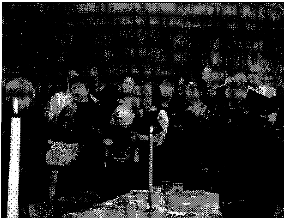
Grensekören är det ursprungliga exemplet på det goda samarbete som utvecklas i gränsregionen.

Sammanställt av projektledarna Gustaf Jillker och Reino Jillker