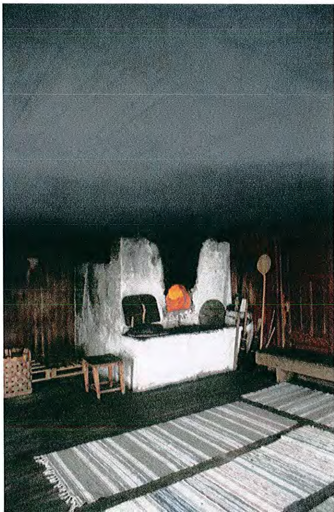
Rökstugan Mattila, Östmark, Värmland. Röken från ugnen ligger som en slöja under innertaket och avger värme under lång tid. En av få rökugnar som fortfarande eldas. Ett kulturarv att värna om.

I lägesrapport nr 1, ansökte vi om att få omfördela medel mellan kostnadsslag p g a ändrade förhållanden sedan ansökan. Detta godkändes av förvaltande myndighet enligt ett beslut 2013-03-15, se bilaga 9.