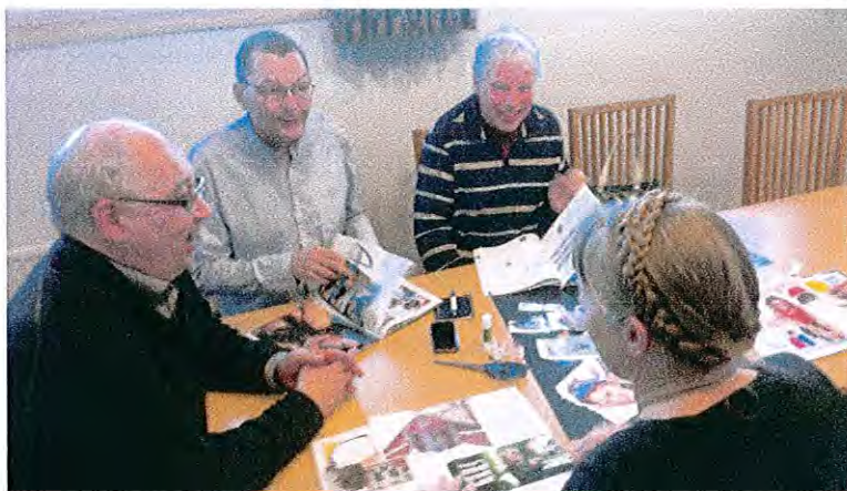
En av grupperna i arbete med att finna Finnskogens själ.

Den 28 februari bjöd styrgruppen in projektgruppen samt enskilda personer, föreningar och näringsidkare till en workshop tillsammans med RIM Idé & Kommunikation AS. Syftet från RIM:s sida var att samla in nyckelord, intryck, känslor, Finnskogens "själ" och mycket mer som deltagarna har kring Finnskogen, för att därefter kunna arbeta fram parkens visuella profil. Dagen var välbesökt, spännande och hektisk!