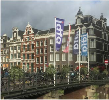
Fra IDFA i Amsterdam

På norsk side har vi samarbeidet med vår co-finansør Filminvest som har tatt med våre deltakere på viktige co-produksjonsmarkeder i Berlin, Cannes og Oldenburg. Sammen med Filminvest har vi også jobbet med utvelgelse, planlegging og gjennomføring av Vårstigen, et initiativ satt i gang for å styrke spillefilmproduksjonen i Trøndelagsregionen. Vi har her vært involvert i planleggingen av en workshop-serie innen manus, distribusjon, markedsføring, budsjettering og finansiering. Første workshop med Erlend Loe på Kongsvoll ble gjennomført 26. og 27. september. Kostnader 240 000 SEK + 250 000 NOK