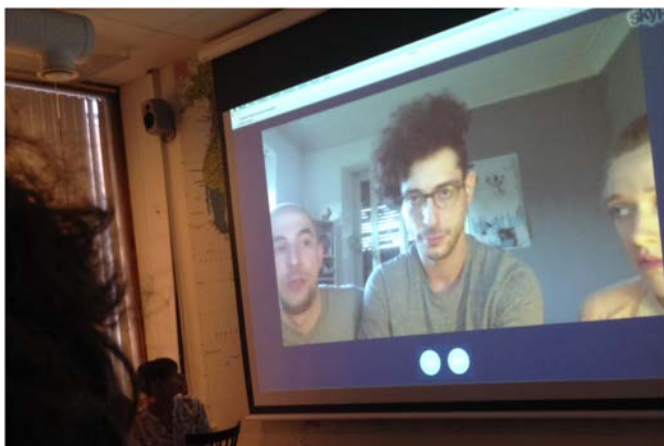
Skypeseminarium med Lights On

Vi har hatt flere deltagere som gjennom prosjektperioden har hatt filmer som ska slussas ut till en internasjonell marknad. Dette sker gjennom deltagende på filmfestivaler og marknader där kjøpere finns. Deltagarna har gjennom projektet fått coaching i denna process. Vi har vært i kontakt med fagmiljøer og invitert en rekke nasjonale og internasjonale eksperter til vår region for å snakke med filmskaperne om hvordan orientere seg på det internasjonale markedet og for å gi mer kunnskap om nye strategier og metoder. Vi har bl. annet hatt Skype seminar med Sam Morrill fra Vimeo som har forklart hvordan deres