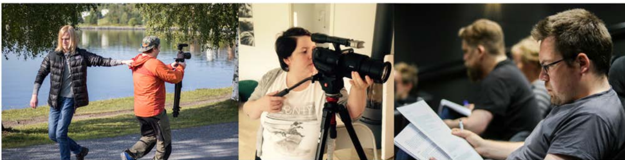
Produktionsworkshop och manusworkshop

nått nationella och internationella arenor. Projektet har således fungerat som en nationell och internationell utvecklingsarena för 35 filmare/filmföretag från den gemensamma filmregionen. Behovsanpassade utvecklingsprogram har bidragit till att etablera regionens filmföretag på den nationella och internationella filmmarknaden. En utvecklingsstrategi har tagits fram per deltagare med fokus på konceptutveckling, research, manusutveckling, projektpaketering, budgetarbete och distribution.