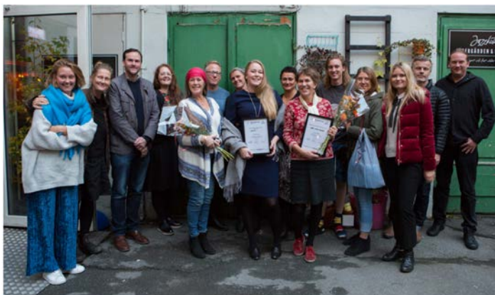
Deltagare och jury Mid Nordic Film Pitch 2018

Mid Nordic Film Pitch är en pitchtävling där tre deltagare från varje region väljs ut för att presentera (pitcha) sin kortfilmsidé för en jury på bestående av nyckelpersoner inom film i Norden. Varje pitch, som är fem minuter lång, följs av tre minuter feedback från juryn. Mid Nordic Film Pitch anordnades i Trondheim hösten 2016 och 2017 i samband med Kortfilmkonventet, samt i Östersund hösten 2018. Pitchtävlingen har varit en