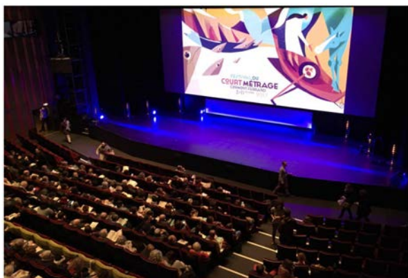
Kortfilmfestivalen i Clermond-Ferrand

særskilt stor oppmerksomhet i regionen/nasjonalt. Dokumentaren I skyggen av oljeeventyret av Marte Hallem, produsert av TMM og Scene Midt fikk kinodistribusjon i Trøndelag og i Kristiansund, og ble sett av rundt 9000 publikummere på kino. Den ble også solgt til NRK. Filmen har ellers vært vist på ulike regionale og nasjonale konferanser knyttet til samfunnsutvikling og ruspolitikk, på ulike kommunestyremøter rundt omkring i Trøndelag, samt brukt i undervisning og av ulike samfunnsforskere. Dokumentaren