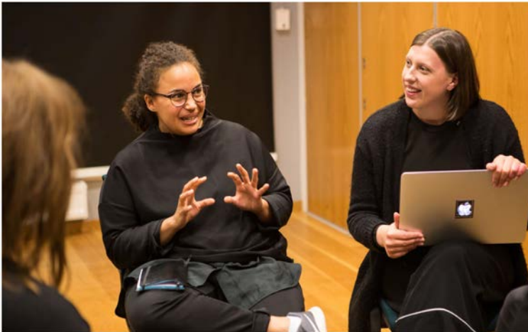
Workshop, kvinnlig nätverksträff i Åre

Projektgruppen har haft en hög medvetenhet gällande den rådande situationen i en icke jämställd