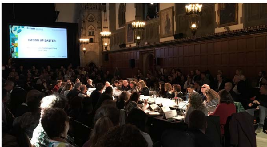
HotDocs Forum i Toronto

Prosjektsamarbeidet kom i gang på grunnlag av tidligere suksessfulle samarbeiden mellom de tre filmsentrene Film Västernorrland, Filmpool Jämtland og Midnorsk Filmsenter gjennom Interregprosjektene Mid Nordic Film Commission og Mid Nordic Film Region. Prosjektets mål har vært å både tilrettelegge for og skape økt vekst hos eksisterende filmforetak i regionen gjennom veiledning, tilrettelegging, nettverksbygging og kompetansehevede tiltak. Projektet har även tillkommit utifrån behov från den inhemska filmbranschen, da filmare och filmarbetare i den gemensamma filmregionen har uttryckt önskemål om att hitta vägar att nå ut med sina filmer samt önskat fortbildning inom olika områden. Hver for oss hadde ikke filmsentrene mulighet til å gjøre dette, men sammen og ved hjelp av prosjektet har vi kunne styrke bransjen både når det gjelder deres kompetanse, nettverk og synlighet utad.