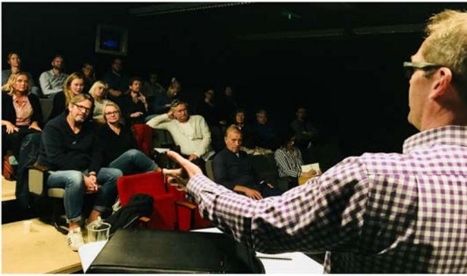
Anders Tangen om internasjonal serieproduksjon

utvärdering av programmet där vi samtalade om utgången. På plats fanns också guldbaggebelönade Jesper Klevenås som berättade om sitt filmskapande som delvis präglats av devisen "guerilla filmmaking".