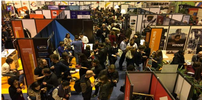
Salgsmarked for kortfilm i Clermont-Ferrand

stasjoner, presse og festivalprogrammerere - samt med kolleger i andre regioner og land. De insatser som gjennomføres i projektet får ses som langsiktige og vi kommer å se flere resultater gjellende eksportsatsning først om några år. Företagen har gjennom projektet fått en ökad kunnskap og medvetenhet i att redan i planeringsstadiet av en produktion definiera filmens målgrupp, samt planera og budgetera för marknadsföring og distribution av filmen. Några filmare har prøvat nya möjligheter og kanaler för att distribuera sine filmer, f.eks gjennom nettaviser og digitale plattformer. I utvekkingsprogrammen har flere aktiviteter gjennomförs i detta syfte. I tillegg har flere filmskaperne solgt sine filmer til nasjonale og internasjonale tv-stasjoner. Projektet har arbeitat aktivt för att förbättra förutsättningarna för kvinnlige filmskaperne. Ett nätverk för kvinnlige filmskaperne har initierats på begge sider av grensen og två nätverksträffar i Åre har anordnats. Nätverket har varit mykket uppskattat og kommer att fortsätta även efter projektets slut.