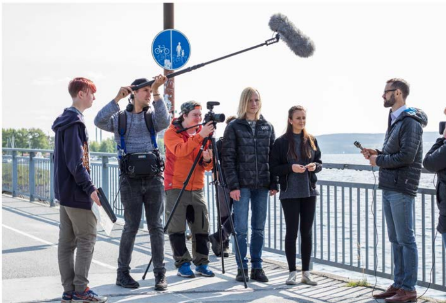
Inspelning av Kärleksbron, regi Johan Hemmingsson

anlitade A-funktioner inom foto och ljud som handledare för unga filmintresserade praktikanter. Hugo och Sebastian, av Rasmus Gustavsson, spelades in under 3 dagar i augusti i Östersund. Även där anlitas A-funktioner (foto, ljud, scenografi, ljus) som handledare.