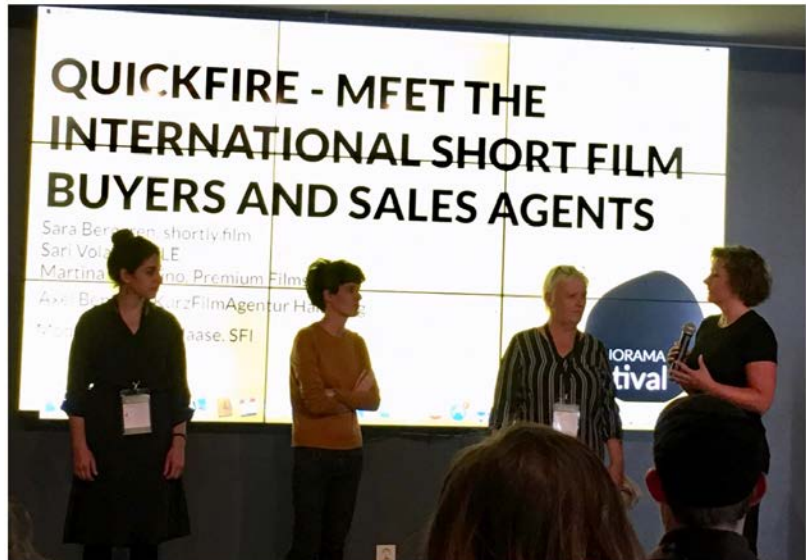
Fra Nordisk Panorama 2018

På norsk side har ekstern finansør Filminvest bidratt betydelig mer enn opprinnelig planlagt inn i prosjektet og Tindved kulturhage med mindre. Det har totalt blitt flere timer enn opprinnelig planlagt på prosjektmedarbeidere fra Midtnorsk Filmsenter på grunn av høy aktivitet i prosjektet og tett oppfølging av den trønderske bransjen. I avslutningen av prosjektet har prosjektleder tatt på seg ekstra oppgaver med hensyn til faglig innhold og oppfølging av prosjektene og i tillegg vært foredragsholder for siste kvinnetreff, samt gjort en grundig innsamling av data til rapporter for senere bruk av bransjen. Høsten 2017 fikk vi ny daglig leder på Midtnorsk Filmsenter. Da det ikke var overlappning mellom forrige og ny daglig leder av filmsenteret, har tidligere leder Solvor Amdal bidratt med timer i forbindelse med rapporteringsrutiner og overføring av kunnskap til ny daglig leder. Vi har avsatt et lite honorar for dette ettersom dette måtte finne sted etter at Solvor hadde sluttet i sin stilling ved filmsenteret. Mot slutten av prosjektet har vi omdisponert fra poster der det sto igjen midler, og utnyttet dette til å kunne støtte flere filmskaperne til å kunne delta på viktige festivaler, markeder og pitche-samlinger, blant annet det splitter nye Doc Norway Market i Bergen.