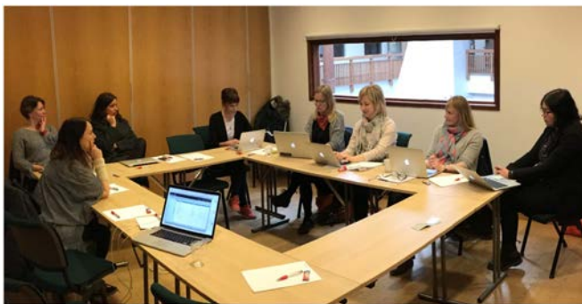
Prosjektgruppemote i Are

Kommunikation har skjedd loepande i projektet fraa forsta till sista dag. Projektet har ett tydlige budskap: att filmforetag ska vaxa og naa en