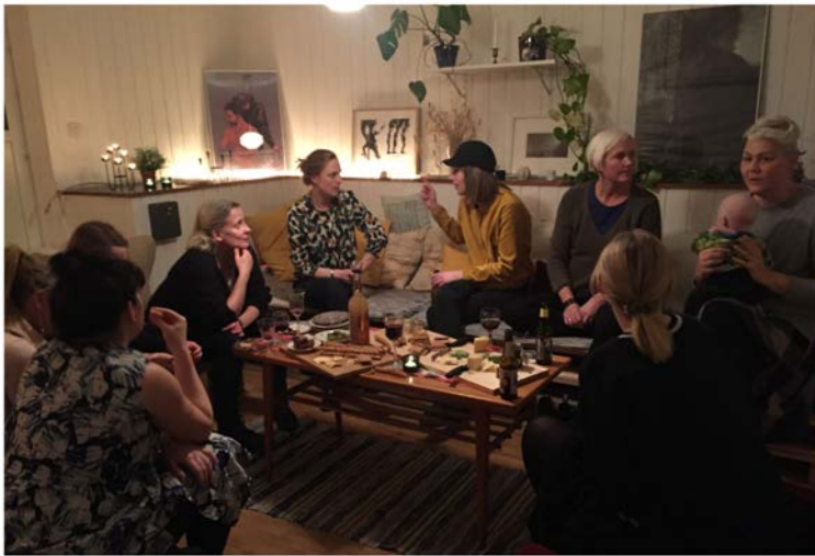
Mingel etter arrangemang

veiledningen fremover. Vi har laget en oversikt over websider og nettverk og samlet viktige rapporter som vi har trykket opp og som filmskaperne kan benytte seg av. Vi ønsker å fortsette Meet the Experts programmet og vi diskuterer å fortsette Mid Nordic Film pitch i en eller annen form som møteplass for våre filmskaper. Vi vil møtes fremover på nordiske møtesplasser som Nordisk Panorama, Sundsvall Filmfestival og Minimalen Internasjonale filmfestival, og har som intensjon å fortsätta att bjuda in varandra till olika arrangemang. Filmskaperne har fått kontakter på begge siden av grensen, noe som gjør det mye enklere å ta kontakt ved eventuelle co-produksjoner eller behov for hjelp med spesifikke fagoppgaver.