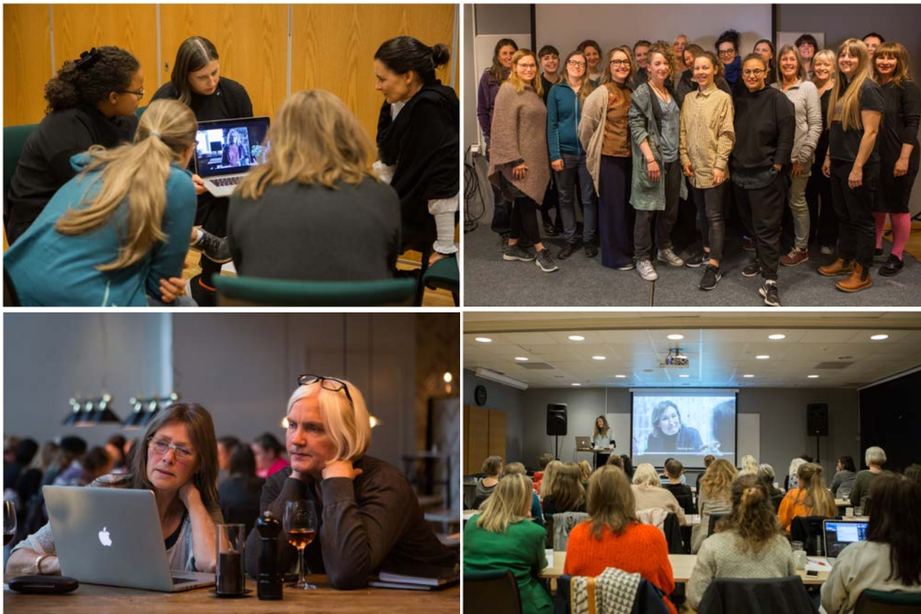
Fra Kvinnesamling i Åre