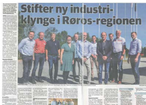
Foto: Projektets insatser för att sprida Mass customization i Fjellregionen har bidragit till bildandet av Norwegian Mass Customization Cluster.

Målet har uppnåtts. Alla fem metoder har uppmärksamats av näringslivets aktörer och kommer att användas framöver. I Dalarna/Värmland kommer BID, KTP, MSS och Tidig Dialog att lämna störst avtryck medan det är BID, Flerkulturell Verdiskapning, MSS og etter etter hvert Tidig dialog i Fjellregionen.