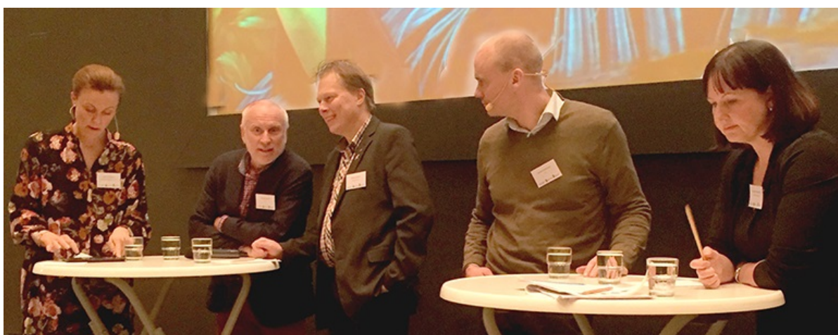
Bild: Företagarna, LRF, SLU, Jönköpings Universitet och Region Dalarna diskuterar framtiden på BID- och Framtidskonferens. Sunne, oktober 2017.