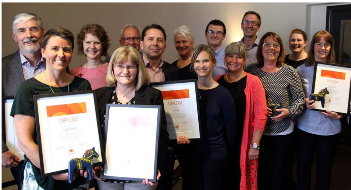
Foto: Första BID-diplomerings i Sverige någonsin. Sv. Stads kärnors Årskonferens, maj 2017.