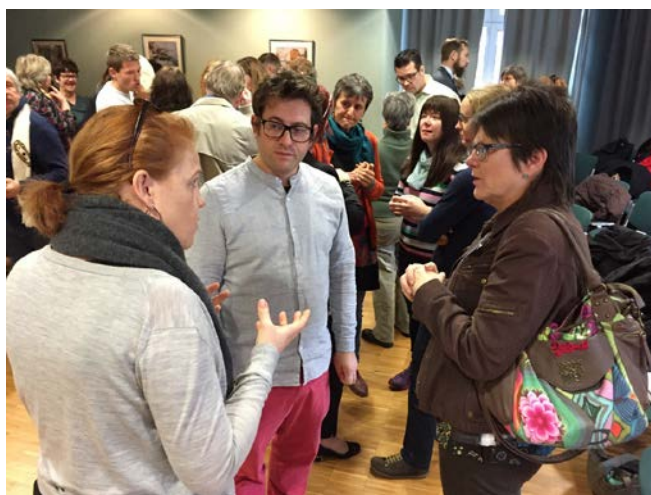
Foto: Intensiv erfarenhetsutbyte mellom Fjellregionen, Dalarna og PLURALP projektet. Lyon sept 2017.