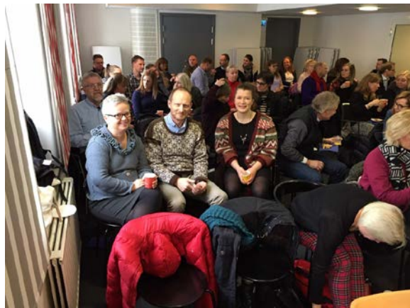
Foto: Rådhuset Vingelen på studietur till Linköping för att lära sig mer om den svenska BID-modellen. September 2017.