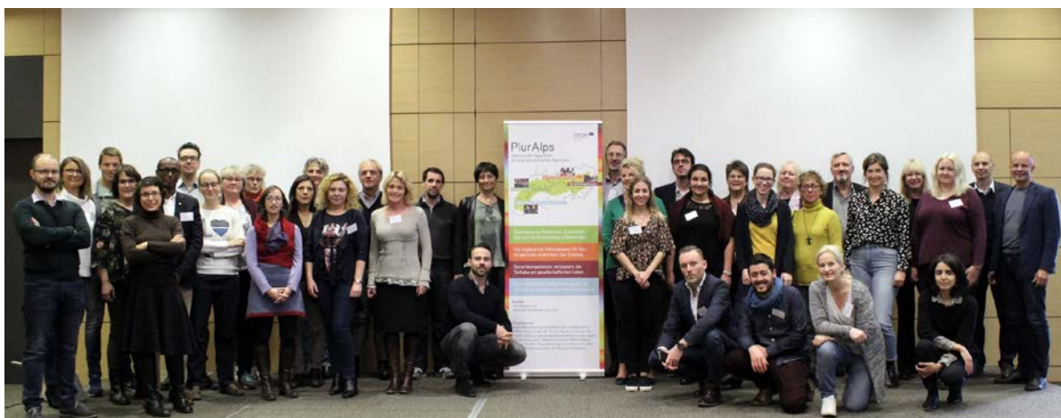
Bild: Utbyte kring integration mellan interreg-projekten Heartland och PLURALPS, i Lyon