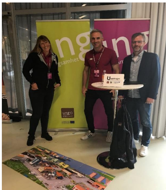
Bilde: Presentasjon av Oppdraget på SM