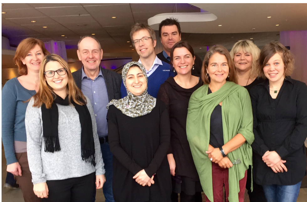
Ett axplock av personal på sekretariatsmöte i Sunne.

På svensk sida har en omorganisation skett, jämfört med förgående programperiod, vilket inneburit att delområdessekretariaten har slagits ihop till ett gemensamt sekretariat som är placerat i Östersund. Samarbetet med de regionala kontaktpersonerna har därmed blivit extra viktigt. På norsk sida finns det tre sekretariat som även är förvaltande organisationer. Nord- och Sør Trøndelag har kontor på två platser, i Steinkjer och Trondheim vid respektive fylkeskommune och de samarbetar med Sverige för delområdet Nordens Gröna Bälte. Vid Hedmark fylkeskommune har sekretariatet för Inre Skandinavien sin hemvist i Hamar. I Sarpsborg på Østfold fylkeskommunen finns det norska sekretariatet för Gränslöst samarbete.