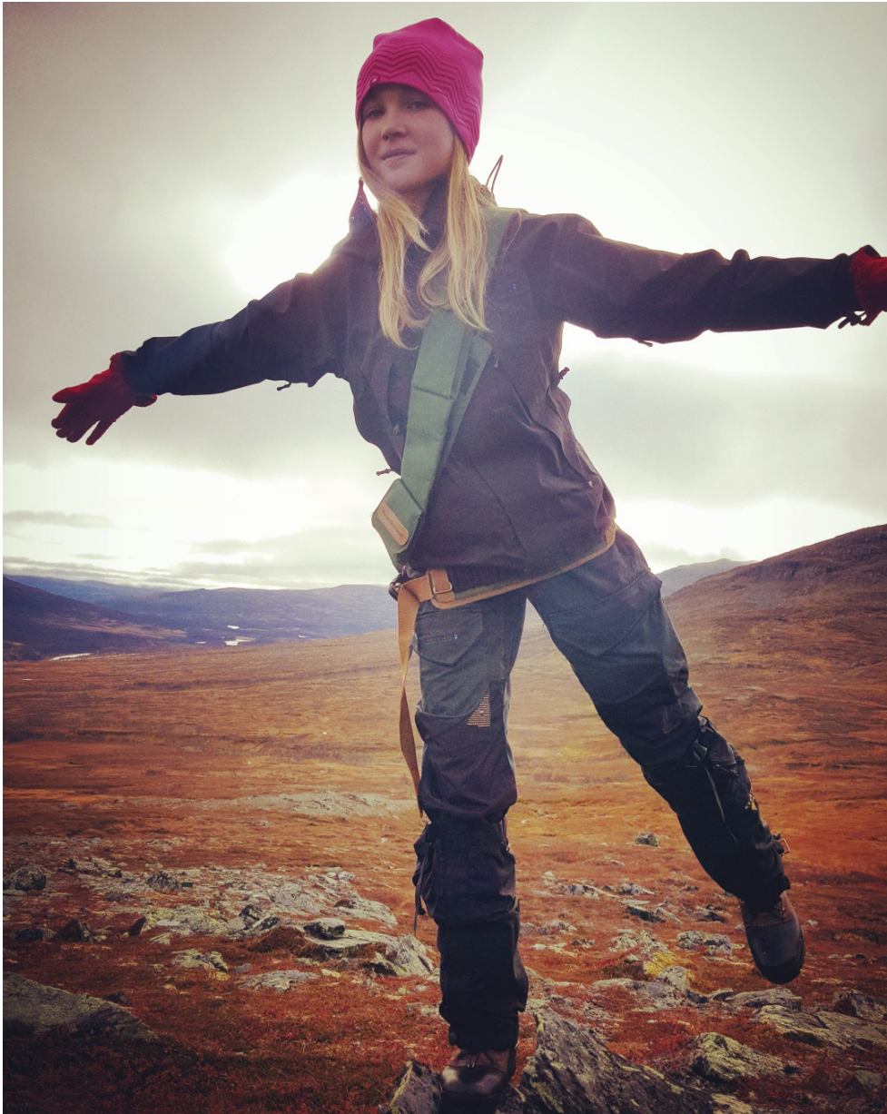
Projektet Fjällkunskap - en del av vårt natur och kulturarv ska sprida kunskap om villkoren i svensk-norska fjällen.

Inom insatsområde natur och kulturarv ska Fjällkunskap – en del av vårt natur och kulturarv sprida kunskap om framförallt Sylarna, som är ett svensk-norskt högfjällsområde med ökande tryck från besöksnäringen. Möjligheter och utmaningar med krav på en hållbar utveckling av turismen, vid sidan om en aktiv renskötsel i en känslig natur. Kunskapen om förhållandena kring våra känsliga fjäll är ofta bristfälliga och åtgärder för ett långsiktigt hållbart system bör till för att skapa förståelse och insikt i fjällfrågorna. Svensk och norsk projektägare är Naboer.