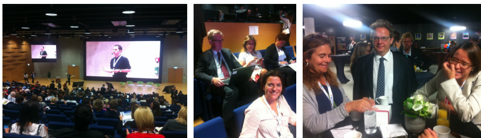
Interreg Sverige-Norge deltog på Interregs årsmöte och firade att det europeiska Interreg-samarbetet fyllde 25 år.

Från nationellt håll samordnas även möten där alla programmen samt de regionala strukturfondsprogrammen i Sverige träffas på förvaltningsnivå. Alla fyra program, med förvaltning i Sverige, har valt att använda den nya gemensamma logotypen som tagits fram på europeisk nivå av stödprogrammet Interact.